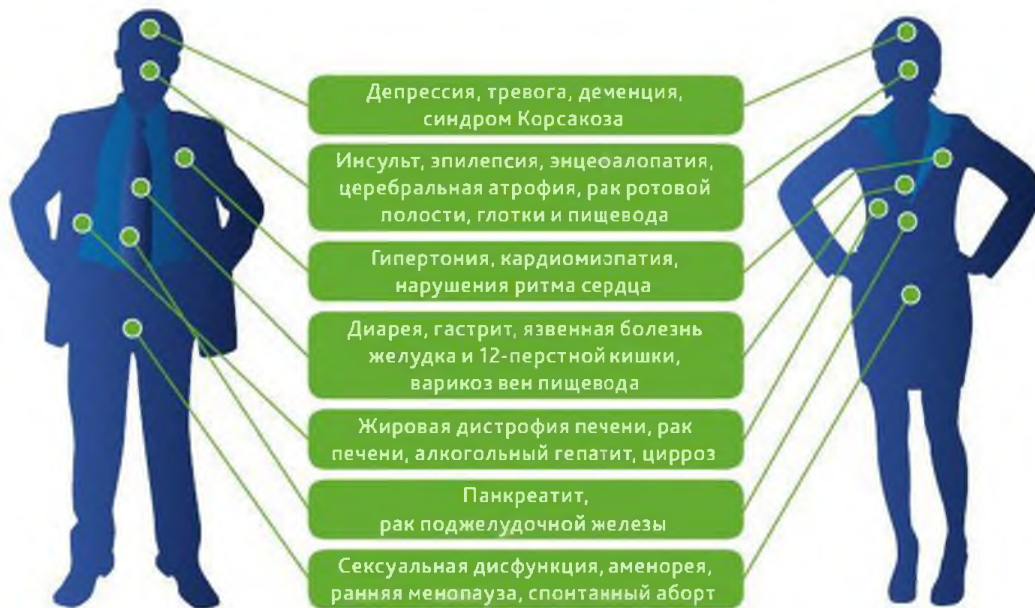
Сокращение потребления алкоголя на 50% снижает риск смерти в восемь раз 4,6